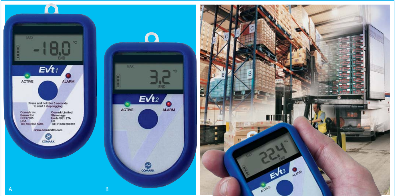
A: EVt1 engangslogger. B: EVt2 flergangslogger.